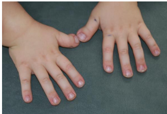
Photo 2: Aspect des mains d'un enfant porteur d'un syndrome de Rubinstein-Taybi à l'âge de 6 ans. Noter les pouces larges en déviation angulaire radiale.