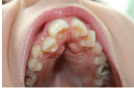
Photo 3 : Cuspides surnuméraires sur les incisives centrales supérieures