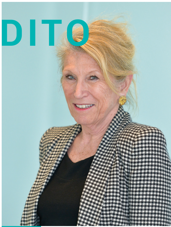
Pr Élisabeth BOUVET Présidente de la commission technique des vaccinations et membre du Collège de la HAS

Le contexte de défiance envers les vaccins est toujours très présent en France et la couverture vaccinale reste contrastée pour certaines maladies ou populations. Or, la menace d'une résurgence de pathologies infectieuses qui avaient disparu rappelle l'importance cruciale de la vaccination comme outil de prévention et d'une couverture vaccinale optimale au niveau national.